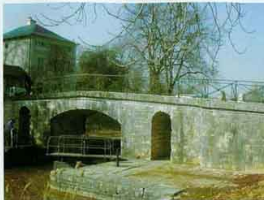
Au bout du chemin, le site de Mantelot et son passage en Loire